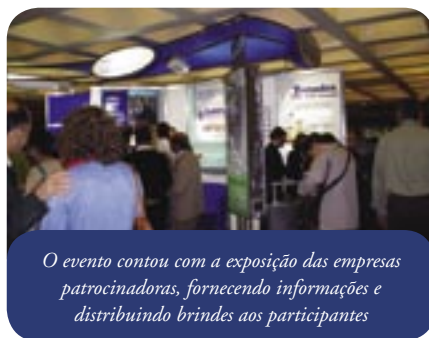
O evento contou com a exposição das empresas patrocinadoras, fornecendo informações e distribuindo brindes aos participantes