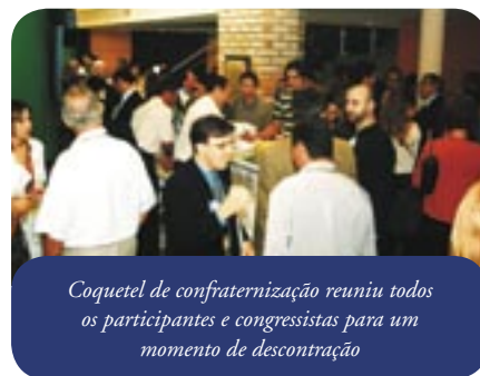
Coquetel de confraternização reuniu todos os participantes e congressistas para um momento de descontração