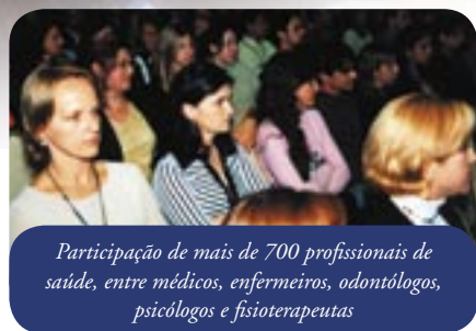
Participação de mais de 700 profissionais de saúde, entre médicos, enfermeiros, odontólogos, psicólogos e fisioterapeutas