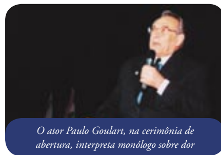
O ator Paulo Goulart, na cerimônia de abertura, interpreta monólogo sobre dor