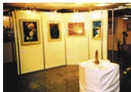
Expo Arte-Dor exhibe obras artísticas dos pacientes.

O Congresso Interdisciplinar de Dor da Universidade de São Paulo (Cindor USP), organizado pelo Centro de Dor e a Divisão de Medicina Física do Instituto de Ortopedia e Traumatologia, do Hospital das Clínicas da Faculdade de Medicina da USP, reuniu mais de mil pessoas entre participantes, visitantes e congressistas nacionais e estrangeiros. De 12 a 14 de maio, em São Paulo, o evento apresentou os avanços na prevenção, diagnóstico e tratamento de dores crônicas e agudas. Dentre os temas, destacaram-se o uso da toxina botulínica na dor e na cefaléia, dor orofacial, alívio de dor, atividades físicas em pacientes com dor, síndrome fibromiálgica, tendinites, lombalgias, técnicas de acupuntura e de estimulação elétrica do sistema nervoso.