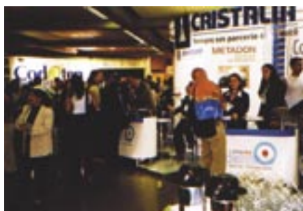
Participantes conferem as novidades dos expositores.