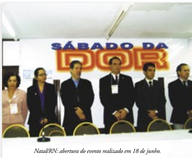
Natal/RN: abertura do evento realizado em 18 de junho.