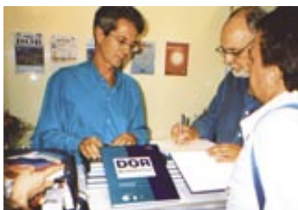
Sessão de autógrafos no estande da SBED.