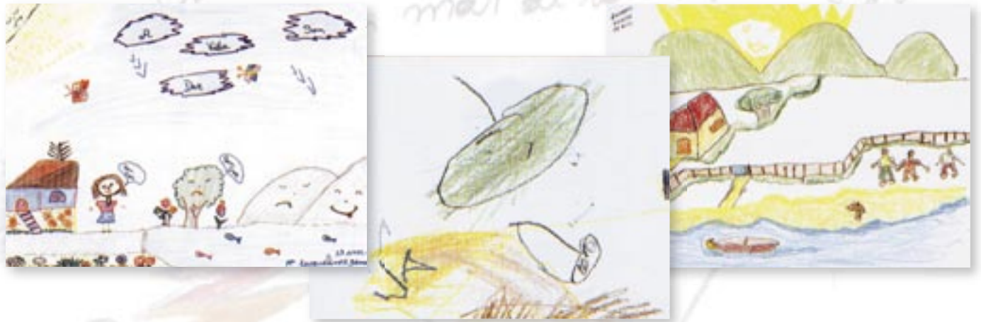
Os desenhos ilustram o calendário de 2005 do Instituto da Criança (ICr)/HCFMUSP.